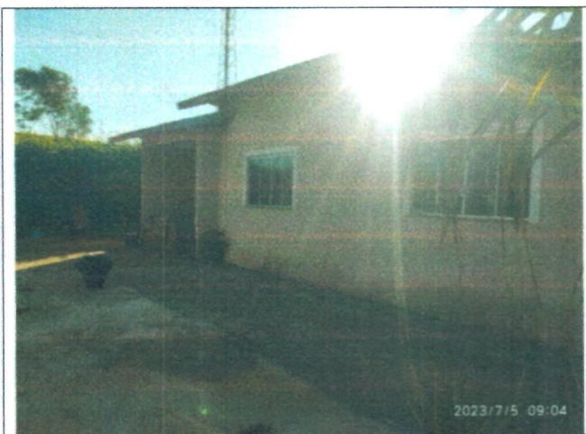
Imagem 09 – Fachada casa residencial