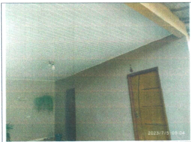
Imagem 11 – Garagem casa residencial