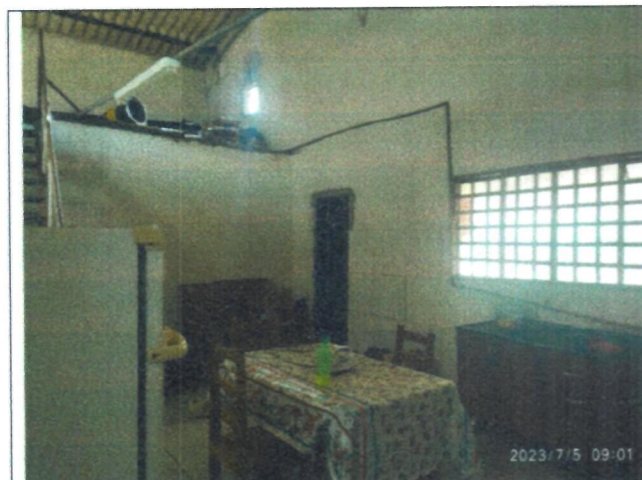
Imagem 07 – Cozinha e mezanino do barracão