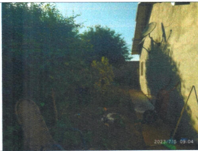
Imagem 12 – Lateral casa residencial