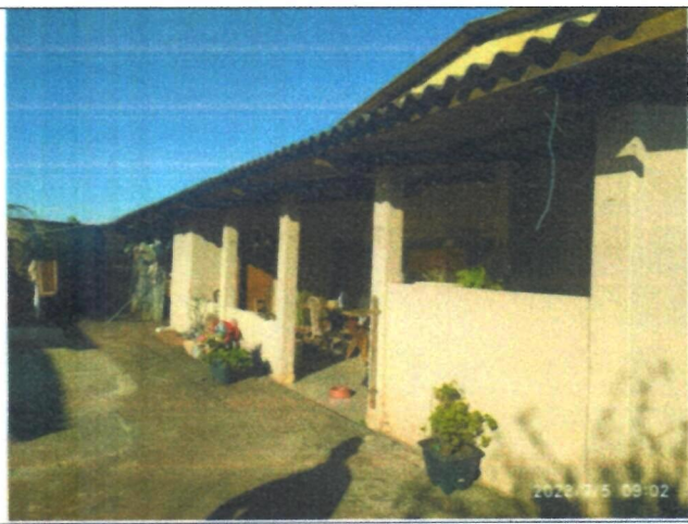
Imagem 10 – Edícula com churrasqueira e banheiro