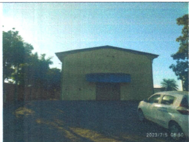
Imagem 02 – Fachada do imóvel avaliando