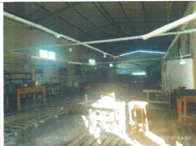
Imagem 04 – Interior do barracão industrial