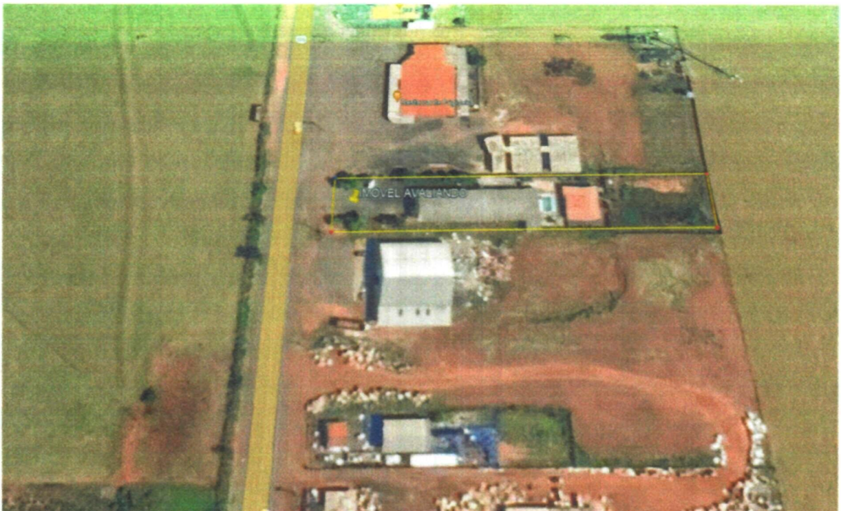
Imagem 01 – Localização do imóvel avaliando