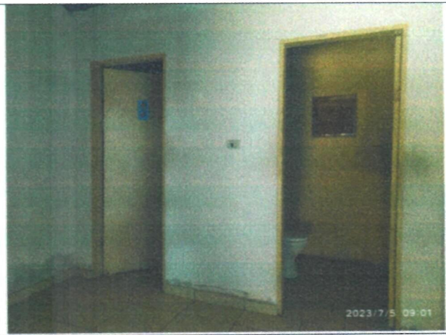
Imagem 06 – Banheiros barracão industrial