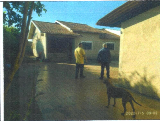
Imagem 08 – Entrada casa residencial