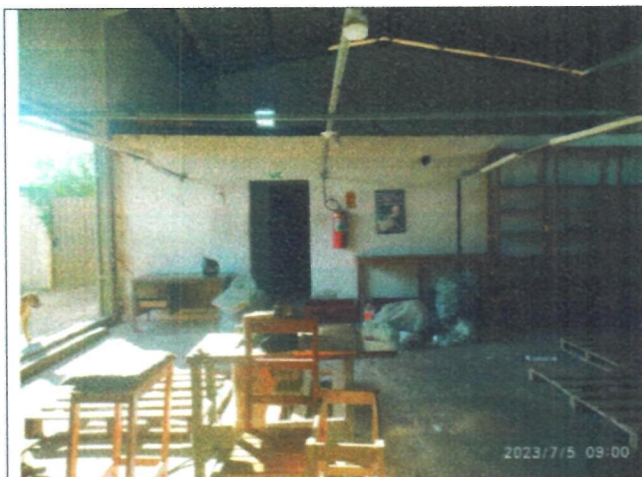
Imagem 05 – Fundos do barracão industrial