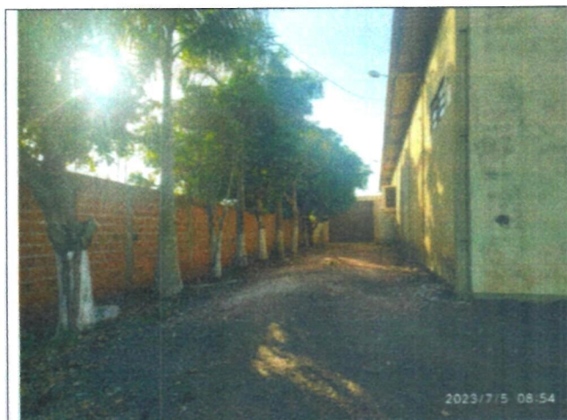
Imagem 03 – Entrada lateral