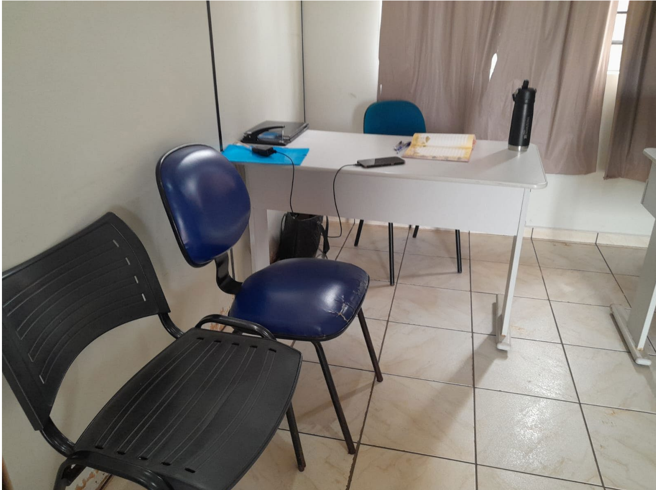
SALA DE ATENDIMENTO