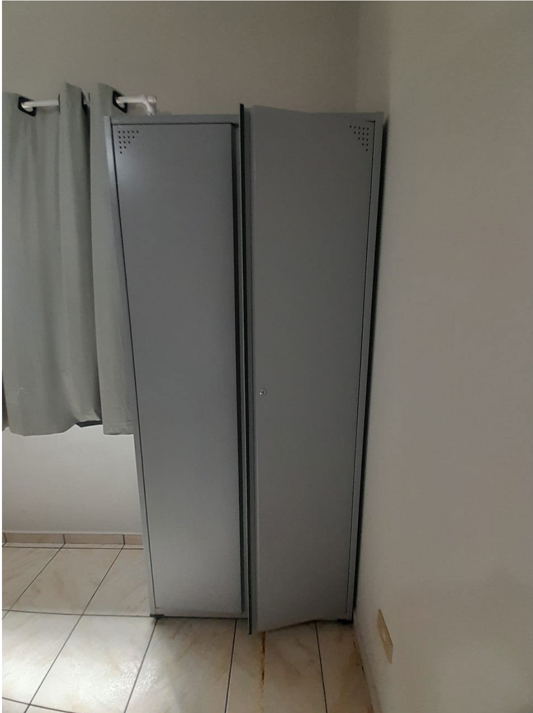
SALA DE ATENDIMENTO – SIGILO