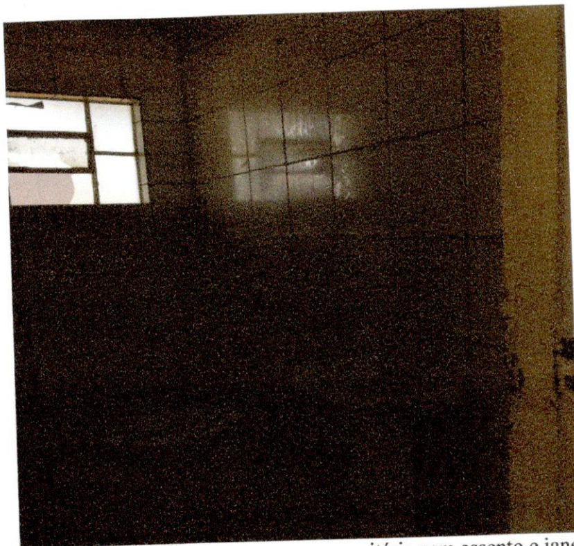
Banheiro masculino com porta sem tranca, vaso sanitário sem assento e janela quebrada