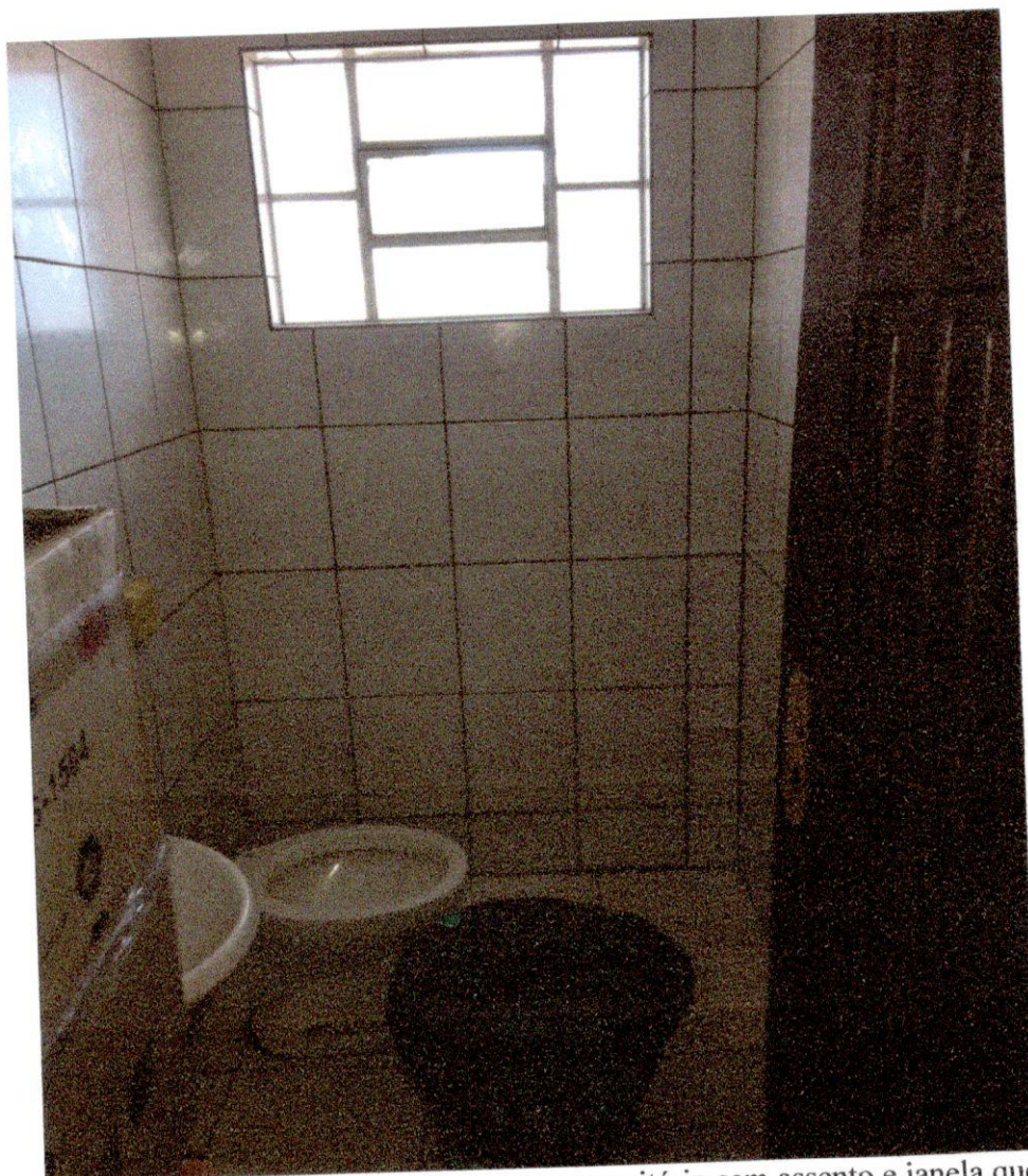
Banheiro feminino com porta sem tranca, vaso sanitário sem assento e janela quebrada