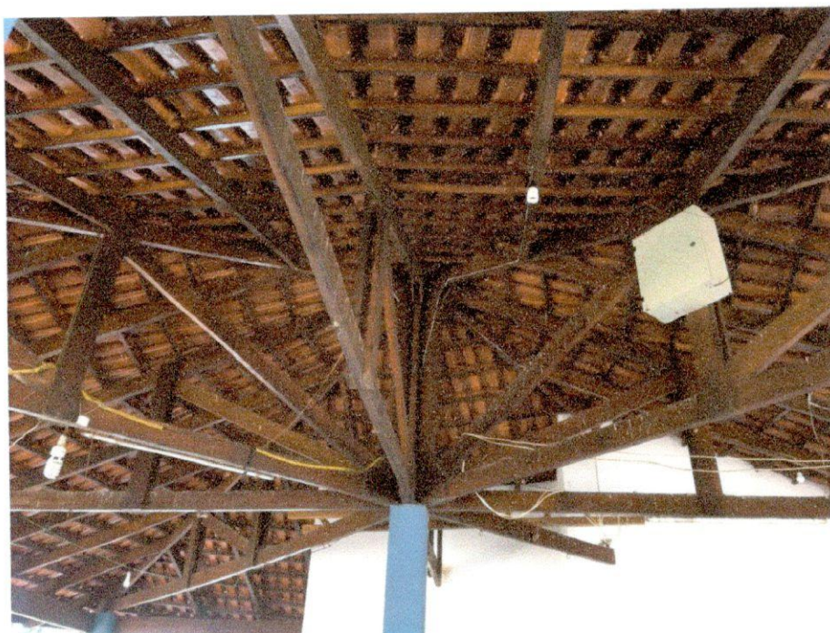
Área externa com telhado e fiação aparente.