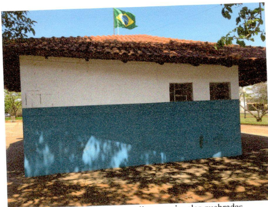
Banheiro feminino e masculino com janelas quebradas.