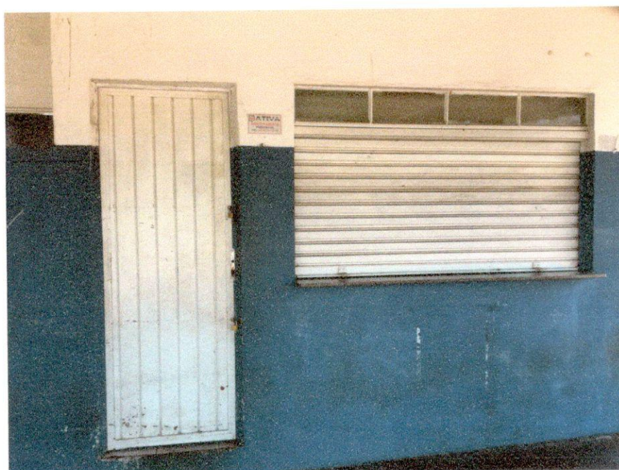
Porta de Alumínio sem tranca, trancada com cadeados. Janela de alumínio com cadeados por dentro.