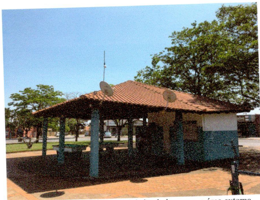
Quiosque com uma cozinha, dois banheiros e uma área externa